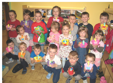
Kolektiv MŠ Bechlín

Zpívali jsme nově naučené velikonoční koledy a ve školce panovala super nálada ☺