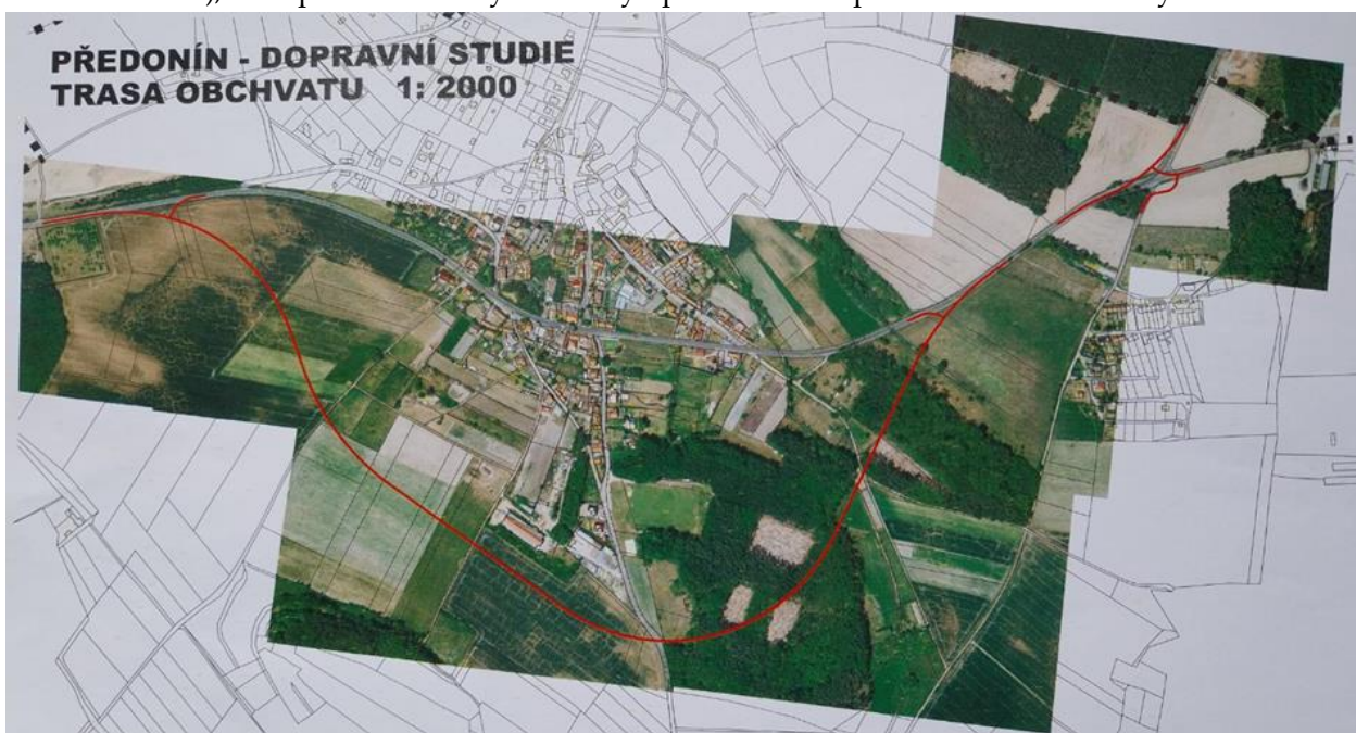
Obrázek č. 1 – Vedení koridoru (obchvatu) jižní stranou místní části Předonín

Dne 22. 6. 2017 byla zadána Změna č. 1 územně plánovací dokumentace pro katastrální území Předonín, týkající se převodu územní rezervy dopravní stavby obchvatu Předonína do konkrétní podoby trasy komunikace. Dne 19. 4. 2018 byla Zastupitelstvem obce Bechlín schválena smlouva mezi Obcí Bechlín a zpracovatelem Změny č. 1 územně plánovací dokumentace Studiem KAPA, kde smluvní vztah byl uzavřen na dobu pěti měsíců, tedy do srpna 2018. Dále proběhly veškeré zjišťovací procesy nutné ke splnění všech zákonných podmínek, včetně zpracování dokumentu „SEA“. Na zpracování konkrétní trasy obchvatu místní části Předonín se podílela jak obec, tak i odborník silničních staveb, Krajský úřad Ústeckého kraje, Úřad územního plánování Roudnice nad Labem a další odborní pracovníci. Shromažďování všech nutných stanovisek a průzkumů bylo zdlouhavé. V návazném kroku bylo na Zastupitelstvu obce Bechlín schválit na svém zasedání dne 3. 8. 2018 vypracovanou Změnu č. 1 územně plánovací dokumentace, jejímž předmětem bylo převedení části území obce Bechlín místní části Předonín z režimu územní rezervy do návrhu změny, a to v podobě přeložky silnice III/24049 jako jižní obchvat obce. Zde nastal ten zlom a svár kudy obchvat vlastně povede. Již zpracovaný projekt, který měl variantu vedení koridoru jižní stranou místní části Předonín (viz obrázek č. 1), se nepotkal s kladnými ohlasy opozice v zastupitelstvu obce a některých občanů.