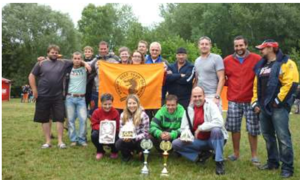
DRAGONTEAM PŘEDONÍN po dvojitém vítězství v Pardubicích v červnu 2011.