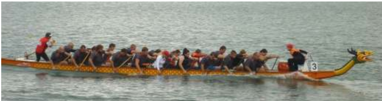
DRAGONTEAM PŘEDONÍN na dvoukilometrové trati v Ostrožské Nové Vsi v červenci 2011.

Nejprve mi dovoluňte, abych Vám pomohl zorientovat se v dračím sportu a vysvětlil Vám názvy soutěží, o kterých už jsem se zmínil. DRAGON BOAT GRAND PRIX je celosezónní soutěž závodů dračích lodí pro amatérské, firemní a fun posádky přátel a kamarádů, které nejsou registrovány pro závody Českého poháru dračích lodí.